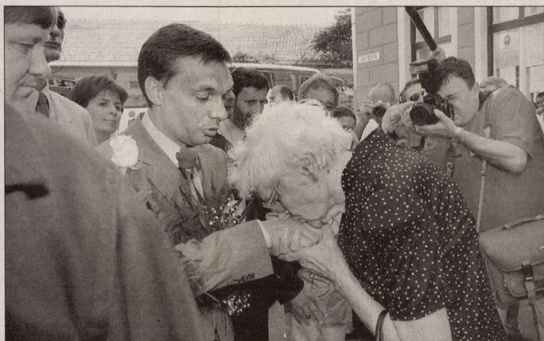
Kézsók Orbán Viktorral, Mezőkövesd, augusztus 7.